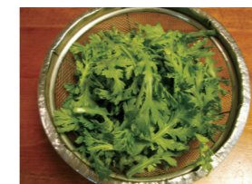
ザルを斜めにするとうまく水が切れますよ